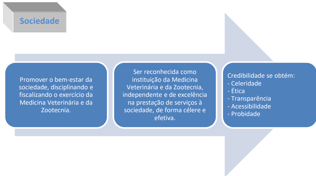
Figura III - Mapa Estratégico – Gestão de Recursos Humanos