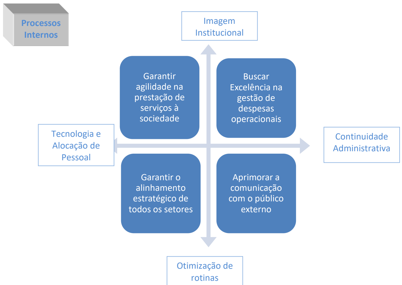
Figura I - Mapa Estratégico – Processos Internos

A partir da identificação dos pontos críticos e das necessidades de aprimoramento, se desenvolveu o mapa estratégico do Conselho Regional de Medicina Veterinária do Estado de Minas Gerais, conforme se vê a seguir: